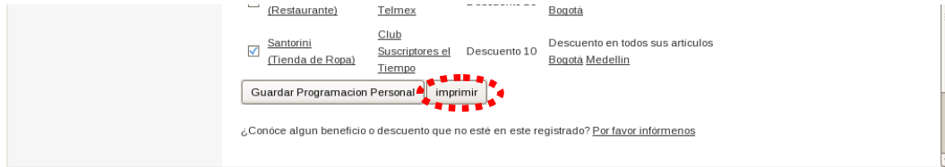
Ilustración 5: Imprima su programación

De clic al botón Imprimir , con el fin de imprimir su programación personal.